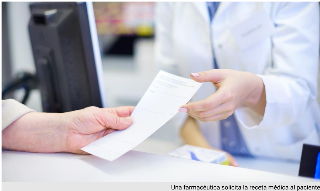
Una farmacéutica solicita la receta médica al paciente.

medicamentos, Canarias, recetas, Población, alcohol