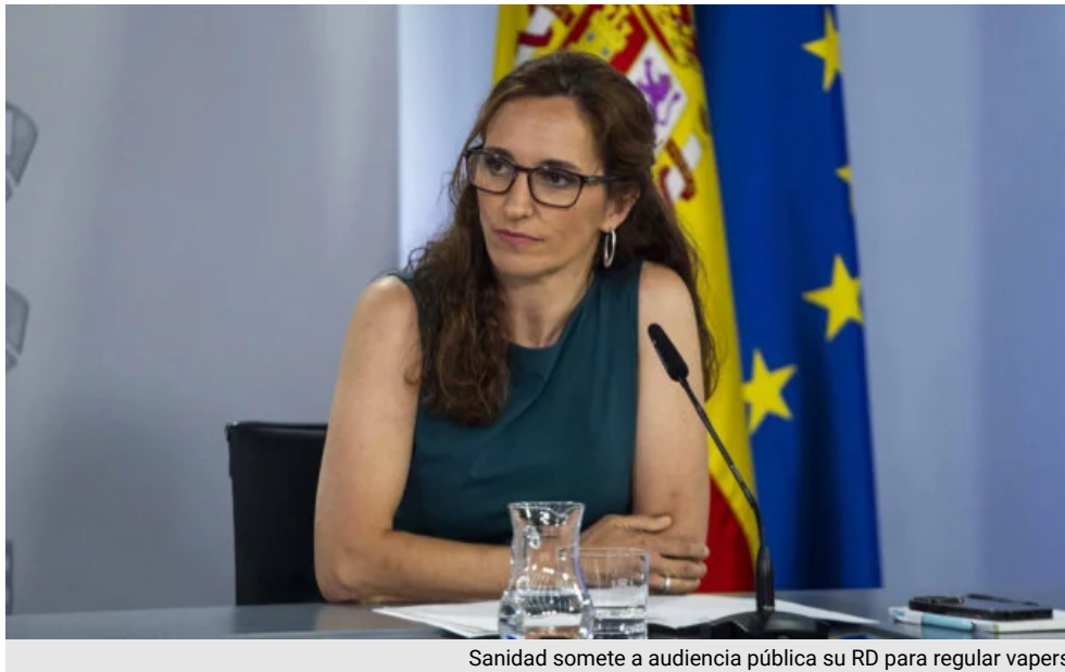
Sanidad somete a audiencia pública su RD para regular vapors